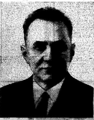
Товарищ А. Н. Косыгин, Председатель Совета Министров СССР, поздравляет советский народ с наступающим Новым годом. Он желает всем здоровья, счастья и успехов в труде и учебе.

В этот день, 1 января 1973 года, мы отмечаем 56-ю годовщину победы в Великой Отечественной войне. Это величайшее событие в истории нашей страны, которое навсегда изменило ее судьбу. Мы гордимся тем, что в этот день мы празднуем победу над фашистскими захватчиками, которые в течение четырех лет пытались уничтожить нашу Родину. Эта победа была результатом мужества и героизма советского народа, его воинов и тружеников тыла. Мы благодарим тех, кто вложил свой вклад в эту великую победу. Мы уверены, что в новом году мы продолжим путь развития и прогресса, укрепляя дружбу и сотрудничество между народами. Мы верим в лучшее будущее нашей страны и всего человечества.