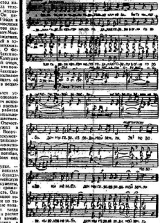
Музыка А. Сидельца. Слова А. Сидельца.