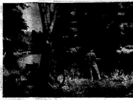
В ТИХОМ ЗАВОДИ.

Где-то огромная вода. То же море, то же море. То же море, то же море. То же море, то же море. Где-то огромная вода. То же море, то же море. То же море, то же море. То же море, то же море.