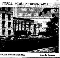
ПЛОЩАДЬ ИМЕНА ЛЕНИНА