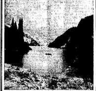
Модифицированная в Сары-Чележском заповеднике