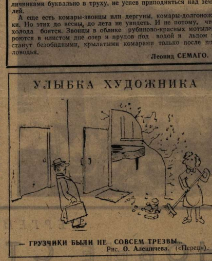
Улыбка художника. Рис. О. Алешечкина.