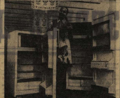
БЕЛОРУССКАЯ ССР. В 1974 году Минский завод холодильников вывел в продажу новые модели холодильников «Минск-10» и «Минск-11».