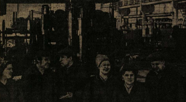
Наш цех металлоконструкций в 1971 году не выполнил государственного плана и в первом полугодии 1972 тоже работал плохо. Естественно, такое положение создаст тревожнo, асек. Было решено создать комплексные бригады слесарей и электросварщиков. Если раньше слесари собирали узлы металлоконструкций, а сварщики их варили, то теперь все освоили по второй специальности, и каждый член бригады может собрать и сварить узлы металлоконструкций.