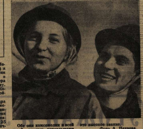
Обе они комсомолки и всей своей жизнью оправдывают это высокое звание.