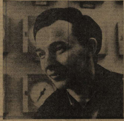
А за правофланговыми идет весь коллектив. Он перекрывает январские задания по всем показателям, успешно работает в феврале. Цель — досрочно завершить пятилетку. А. АСТАХОВ.