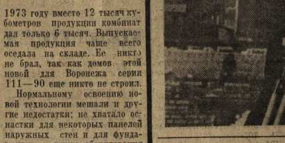
Метод бригадного подряда горький привкус формализма