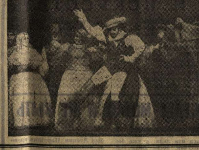
В музыкале Жака Оффенбаха — скенитка и напевная — можно услышать причесанные трогательной лиричности.