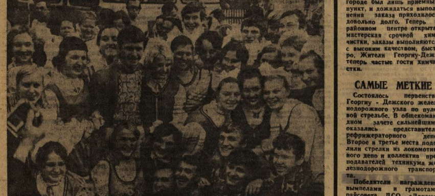
Георгию-Дежский народный ансамбль песни и пляски «Радуга», участников которого вы видите на снимке, известен во только в городе, но и за его пределами.