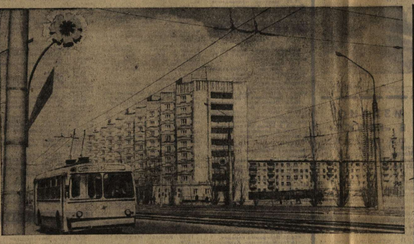
ВОРОНЕЖ. СЕВЕРО-ВОСТОЧНЫЙ МИКРОРАЙОН.