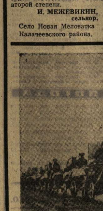
Обратите внимание на снимок. Плакат на переднем плане объясняет назначение надписей. В ответ на надписи выданы ответы от имени досрочной сдачи хлебопашатки государству. Миллионы трудящихся страны, где бы они ни жили — в городе или в деревне, — своим самоотверженным трудом ковали победу над врагом.

Единство фронта и тыла было одним из главных условий разгрома немецко-фашистских захватчиков.