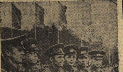
Утром 9 мая тысячи жителей Воронежа направились к братским могилам советских воинов, павших смертью храбрых в боях против фашистских захватчиков. Там состоялся многотысячный митинг.

Торжественно отметили в Воронежской области 29-ю годовщину Победы советского народа в Великой Отечественной войне 1941—1945 годов. На предвечерних, в учреждениях, учебных заведениях, организациях патристично проводились лекции, беседы, торжественные собрания, театральные вечера, посвященные этой знаменательной дате.