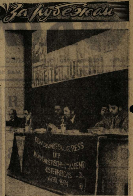
В здании «Виланджуле», расположенном в рабочем районе Вены, состоялся первый съезд коммунистической молодежи Австрии (КМА). Эта организация была создана четыре года тому назад — 10 мая 1970 года.

И. СПИРИН, заместитель директора, главный зоотехник объединения «Объединхозостроиторм».