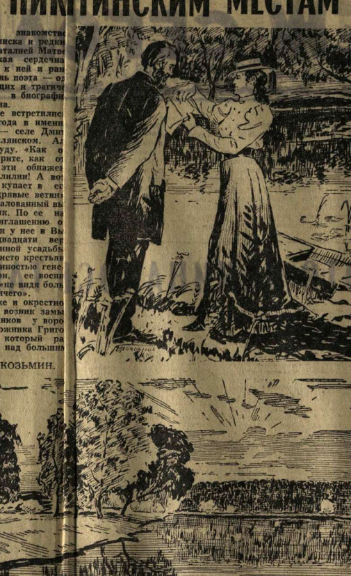
Пятилетнее пактостроение — большая переписка и режки встречи с Натальей Матвеевой, глубокая сердечная привязанность к ней и ранняя ушедшая из жизни — вот на изволующих и трагических страницах в биографии Ивана Никитича.