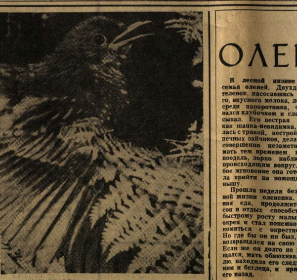
ПТЕНЕЦ ДРОЗДА.