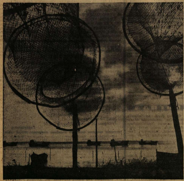
Рыбацкие сласти на взморье.