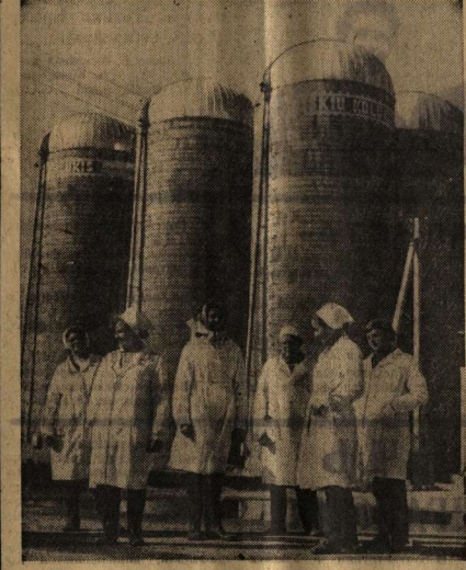
В колхозе «Эришувя» Палежского района построена молочнотоварная ферма на 900 коров. Ее обслуживают 8 человек. Шесть человек вы видите на снимке.