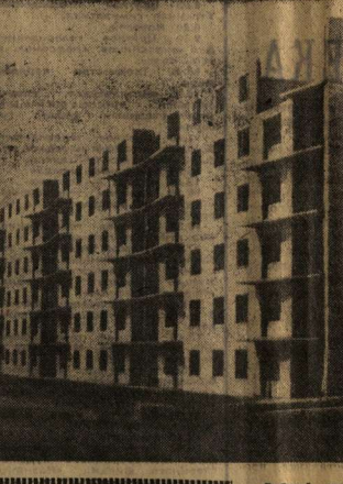
Добрый подарок ворончанам приоткрыл строители Воронежского территориального управления. Началось возведение крупнопанельных жилых домов новой серии III-90 — благоустроенных с отличной внутренней планировкой.

Ю. ЮРИН, секретарь парткома строительств № 2.