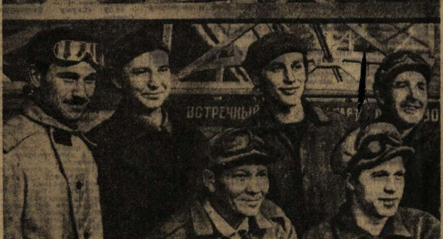
Встреча с молодежью в Солдатском.