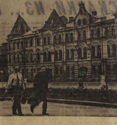
НА СНИМКЕ: одно из старинных зданий на улице Среднемоховской.

интенсивная работа по окрашен фасадов зданий. Главная цель — обеспечить выразительное общее колоритическое решение наиболее интересных с архитектурной точки зрения ансамблей. На проспекте Революции работы выполняли молодые скверники у Дома художественной самостоятельности профсоюзов, у Дома офицеров, у главного почтамта. Обновились фасады старинных торговых зданий. Они стали более привлекательными и нарядными.