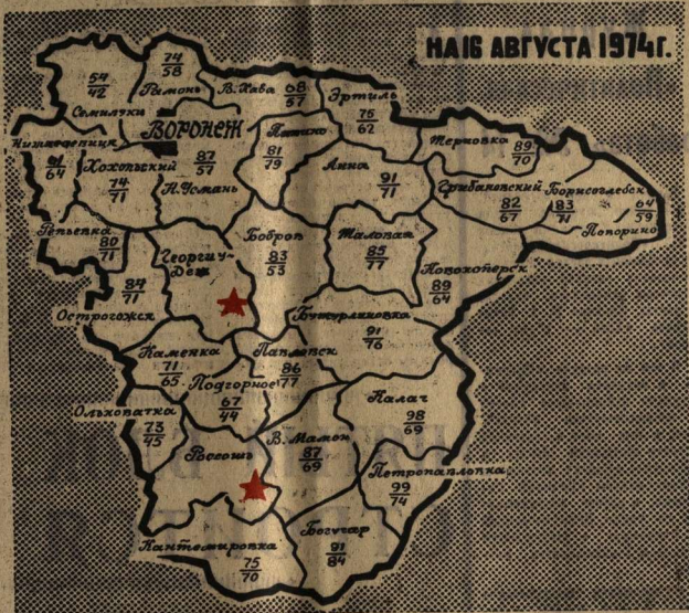
Примечание к карте: числитель — обмолочено ранних зерновых и зернобобовых в процентах к плану; знаменатель — процент выполнения народнохозяйственного плана продажи зерна государству. По Павловскому и Таловскому районам данные об обмолоте на 15 августа.

ЩЕДРЫ ПОЛЯ. ЗОЛОТЫМ ДОЖДЕМ СЫПЛЕТСЯ В КУЗОВА АВТОМАШИН ЗЕРНО. СДЕЛАЕМ ЖЕ ВСЕ, ЧТОБЫ СТАЛИ ИЗОБИЛЬНЫМИ НАШИ ЗАКРОМА. СДЕЛАЕМ КАЖДЫЙ ДЕНЬ СТРАДЫ УДАРНЫМ, ЧТОБЫ НАШ НЫНЕШНИЙ ЭНТУЗИАЗМ ОБЕРНУЛСЯ ЗАВТРАШНИМИ ТОННАМИ, ЦЕНТНЕРАМИ, КИЛОГРАММАМИ В СЧЕТ НАШИХ ВЫСОКИХ ОБЯЗАТЕЛЬСТВ.