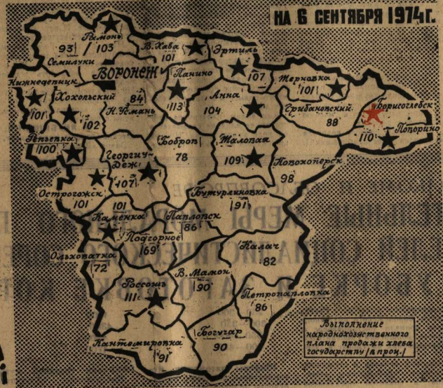
НА 6 СЕНТЯБРЯ 1974г.