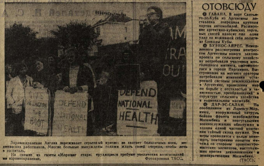
Здоровохранение Англии переживает серьезный кризис: не хватает больничных коек, медицинских работников. Многие больные вынуждены годами ждать своей очереди, чтобы лечь в госпиталь.

Многих студентов и выпускников нашего университета знают не только как хороших специалистов, но и как хороших организаторов. Особенно тех, кто еще недавно занимался в студенческих организациях, пропагандистов, руководителей художественных коллективов, пионервожатых, общественных политиков, а теперь — экскурсоводов. Помимо своего факультета, они окончили еще и факультет общественных профессий, или ФОП, как сокращенно называют его в университете, существует четыре года. Вначале обучали 300 студентов, а в нынешнем году — 2202. В пер-