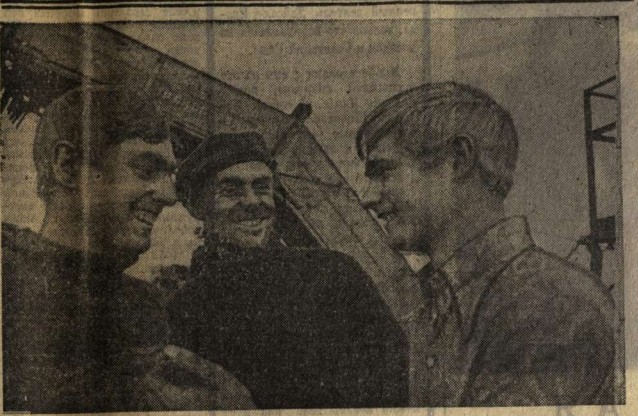
Что и говорить, нелегкий труд свекловода! Отлично понимают его механизаторы...