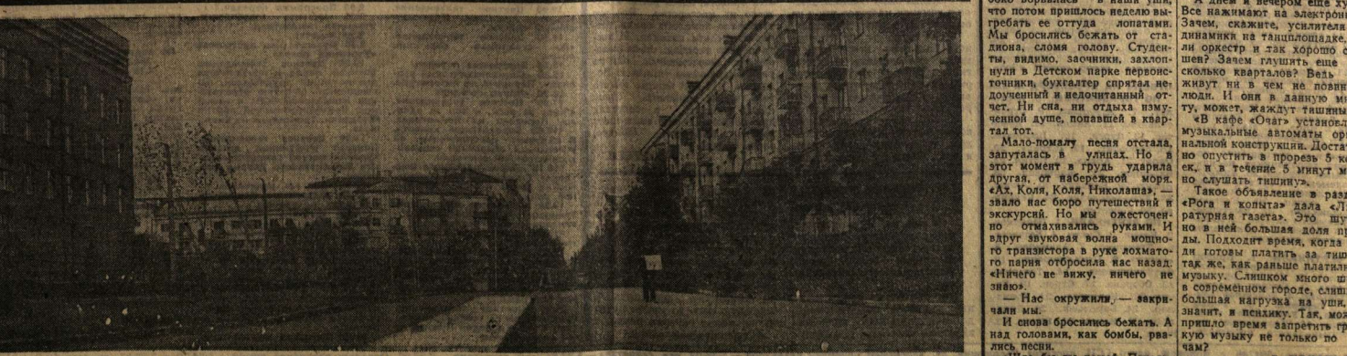
Город мой, любовь моя. Улицы имени Володарского.

Ильича состоялся премьеры, рассказывая о студенческих годах Владимира Ульянова. В обстоятельной рецензии на этот спектакль газета «Ульяновская правда» писала, что «новый спектакль воронежцев — работа серьезная, несущая большую идейную нагрузку». Ленина, — все это навсегда сохранит в своей памяти каждый артист, каждый работник нашего театра. «Ревюер», «Недоросль», «Конец горбунов», «Красная шапочка» и многие другие спектакли ТЮЗа увидели новые зрители Ульяновские. Черные