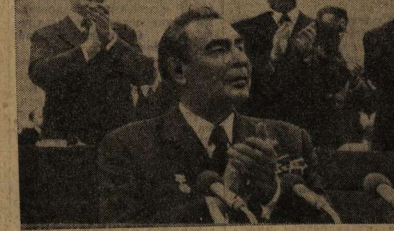
БЕРЛИН, 6 октября. Выступление Л. И. Брежнева на торжественном заседании, посвященном 25-летию образования ГДР.