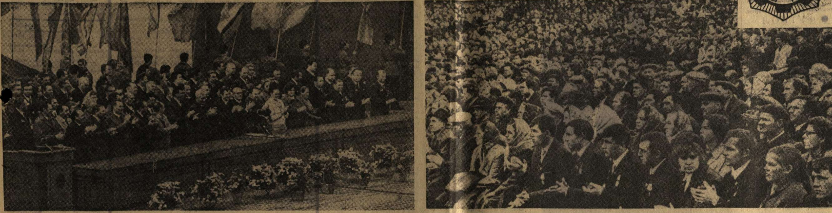
Зеленый театр Центрального парка культуры и отдыха. Идет торжественное собрание, посвященное Всесоюзному Дню работников сельского хозяйства.