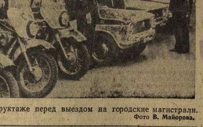
Сотрудники ГАИ на инструктаже перед въездом на городские магистрали.