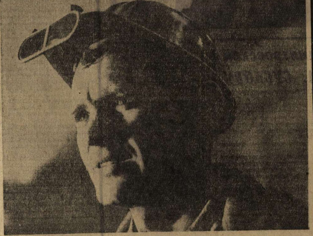
ДНЕПРОПЕТРОВСКАЯ ОБЛАСТЬ. Миллион тонн стали началась года — значительно раньше срока, намеченного в обязательствах — выплыла на двухэтажном сталелитейном агрегате № 1 мартеновского цеха Кировского металлургического завода имени В. И. Ленина.

ПАВЛОВСКИЙ (соб. корр. «Коммуны»). В местном районном лесхозе построен свой клуб со зрительным залом на 200 мест. Клуб возведен руками самого коллектива.