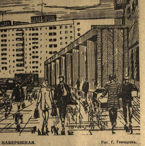
ОТРОРСКАЯ НАБЕРЕЖНАЯ. Рис. Г. Гончарова.

«Воснианка» испытывает немало трудностей. Нельзя сказать, что руководители района не помогают, неинициативны к ней. Но ведь как поведет себя районная мать, не определит шефа, который бы повседневно и конкретно вникал в деятельность ансамбля. Такая работа требует выбора стелла в окнах, а установить их нелегко. Но самая большая трудность — это отсутствие постоянного помещения для репетиций.