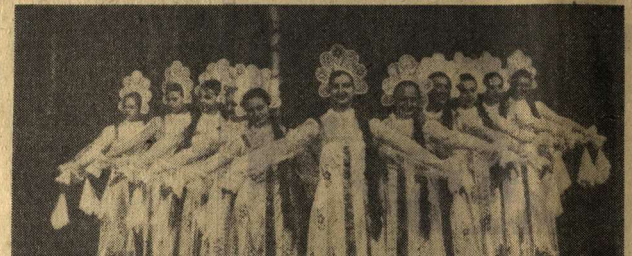
НА СНИМКЕ: выступление ансамбля. Фото Э. Кобяка. Фотохроника ТАСС.

БЕЛОУССКАЯ ССР. Танцевальный ансамбль «Юрочка» Барановичского городского Дома культуры пользуется большой популярностью у зрителей. Коллектив выступил в Москве, во многих городах Белоруссии. Телепередача, записанная самодельными студиями ансамбля в Чехословакии и Польше. В репертуаре «Юрочки» преобладают белорусские народные танцы. Сейчас ансамбль готовит новую программу, которую покажет зрителям в конце года. НА СНИМКЕ: выступление ансамбля. Фото Э. Кобяка. Фотохроника ТАСС.