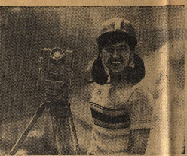
1800 тысяч киловатт — такой будет мощность строящегося энергетического гиганта Киргизия — Токтогульского ГЭС, третьей из каскада электростанций, которые возводятся на реке Нила. Высота плотин уже достигла 150 метров. В основные сооружения уложено более двух миллионов кубометров бетона. Приближается время, когда ГЭС даст энергию, а жилищная вахта Токтогульского моря — жилья 480 тысячам гектаров целинных и залежных земель Киргизии и других среднеазиатских республик.

Что касается ДЮСШ «Локомотив» то это открытие благотворно сказалось на юношеском и детском футболе в Воронеже. И надо не погорать, а приветствовать, что се спортсмены выступают с таким энтузиазмом в «Факелах», мастозавода и других клубов. Но сегодня не столько это должно беспокоить руководителей городского комитета, сколько необходимость в организации проведения, судействе, учебно-тренировочном процессе. Это и есть резервы качественного роста городского футбола, на них нужно обращать особое внимание. За последние годы нам нужно обратиться к ним с уважением, но подходить к ним следует осторожно, обоснованно и не забывать о поговорке: «Семь раз отмерь, один раз отрежь».