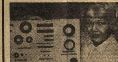
ПОЛЬША. Завод «Уинтра-Полфер» в Варшаве выпускает ферритовые стержни. Эти детали (на снимке) используются в радиоаппаратах, электронных машинах. Часть продукции предприятия экспортируется, в том числе в страны — члены Совета Экономической Взаимопомощи.

МНР собрали деньги на постройку танковой колонии «Революционная Монголия» и авиавзвездия «Монгольский арат». Советские летчики и танкисты с честью выполнили свой воинский долг. Еще часть с боевой силой достигли пути по дороге войны и закончили его в Берлине. Кроме танковой колонии и авиавзвездия, для нужд Советской Армии были переданы сотни тонн военной и гражданской техники, продовольствия и подарков. Трудящиеся Монголии были собраны значительные средства на восстановление районов, освобожденных от немецких оккупантов. Советские граждане не забывают эту бескорыстную помощь в трудное для них время.