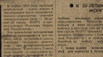
В ноябре 1974 года братский монгольский завод вместе с трудящимися всего социалистического содружества отмечает знаменательные даты — 50-летие III съезда МНРП и провозглашение Монголии Народной Республикой.