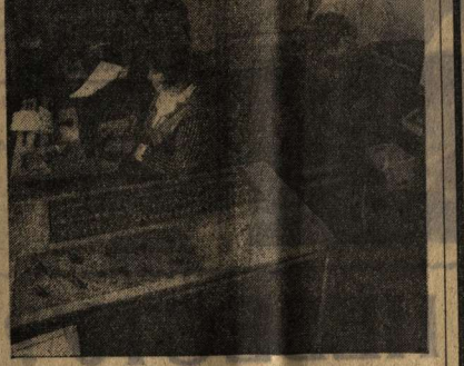
КАБИНЕТ ПАРТИЙНОЙ ИНФОРМАЦИИ

Проведенные райкомом партии исследования показали, что многие из них не знают сложившихся традиций в системе партийной учебы, не владеют формами и методами руководства идеологической деятельностью, еще низок их образовательный уровень.