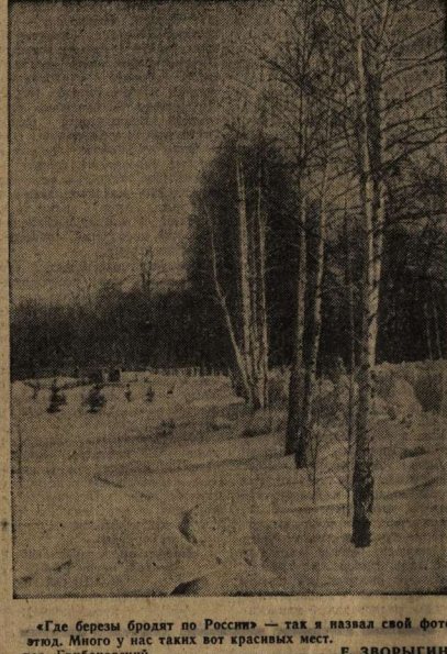
«Как берем брады по России» — так и назвал свой фотосюжет. Много у нас таких вот красивых мест.