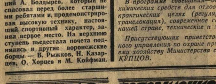
В Воронежском государственном заповеднике завершена работа по охране природы, заповедника и охотничьему хозяйству.