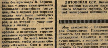
Продукция предприятия реализуется не только в нашей стране, но и экспортируется за границу.