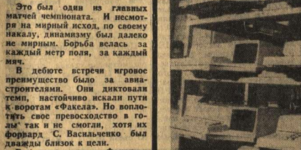
Литовская ССР. Вильнюсский завод электромеханической техники выпускает клавишные счетные машины...