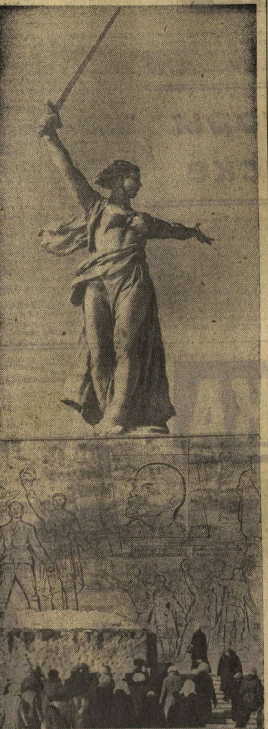
Эта главная скульптура памятника ансамбля в честь героев Сталинградской битвы — Родина-Мать.