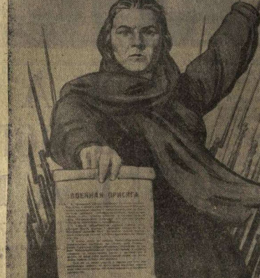
ВЕСЕ НА БОРЬБУ С ФАШИЗМОМ

КЛУБ ЗАВОДА имени ЛЕНИНА — Черный чулок (18, 19, 20, 20.30).