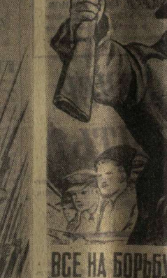
ВЕСЕ НА БОРЬБУ С ФАШИЗМОМ