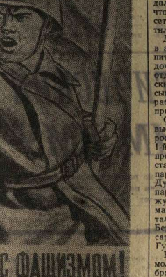
ВЕСЕ НА БОРЬБУ С ФАШИЗМОМ