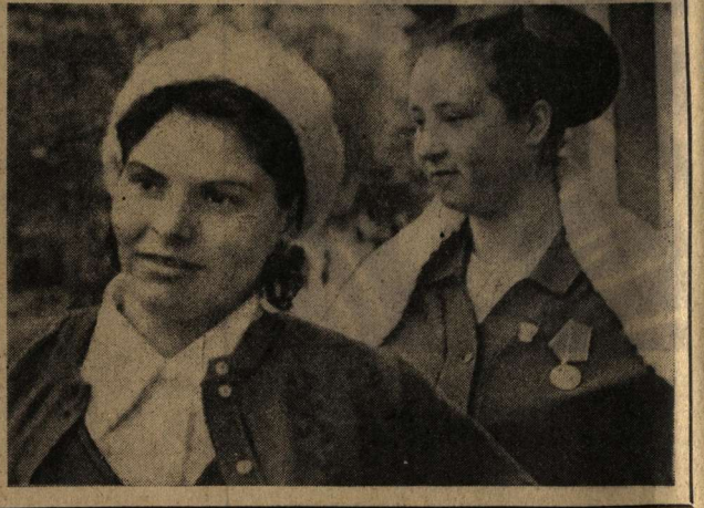
Точно сказано поэтом: Из одного металла льют медаль за бой, медаль за труд.