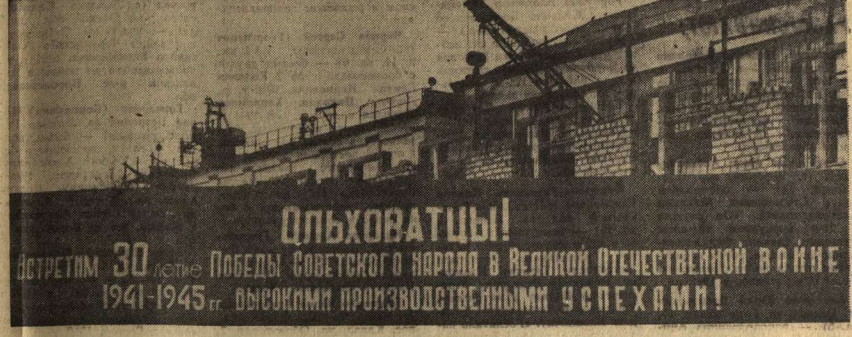
НА СНИМКЕ: новостройки Олыватки.