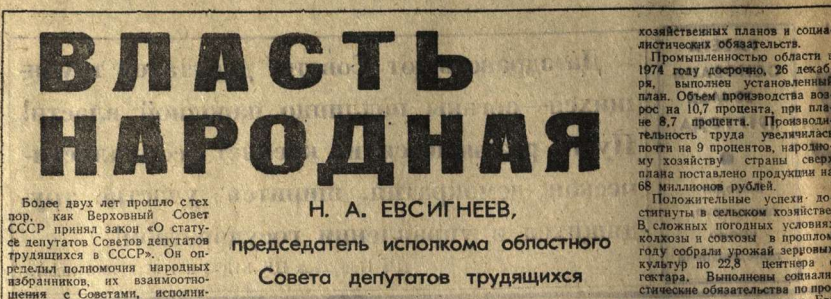
Волне двух лет прошло стех пор, как Верховный Совет СССР принял закон «О статусе депутатов Советов депутатов трудящихся в СССР». Он определил положение народных избранников, их взаимоотношения с Советами, исполнительными и распорядительными органами, общественными организациями, коллективными предприятиями.

Осуществление закона способствует повышению активности депутатов, развитию инициативы, дальнейшему совершенствованию всей деятельности Советов. В его статьях закреплено органическое единство прав депутата, как представителя государственной власти с его обязанностями перед избирателями и Советом.