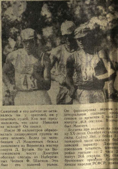
Сомнений в его победе не оставалось...