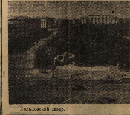
Колыловский сквер.

В хлебопекарном объединении № 2 впервые освоены выпуск сдобы лимонной. Она выпекается из муки высшего сорта, а в рецептуре сахар, масло растительное, масло лимонное. Старательно трудятся на ее производстве комплексная бригада, руководимая А. Е. Лагутиним. Суточный выпуск новинки достиг 3,5 тонн. На пшеничном объединении производят мясные хлеба. Это вид кобасных изделий «Лобельская» и «Огдельная», имеющих форму прямоугольных хлебов, без оболочки и шпатага. Вес одного такого хлеба до 2,5 килограмма. Коллектив производственной масссырья освоил изготовление