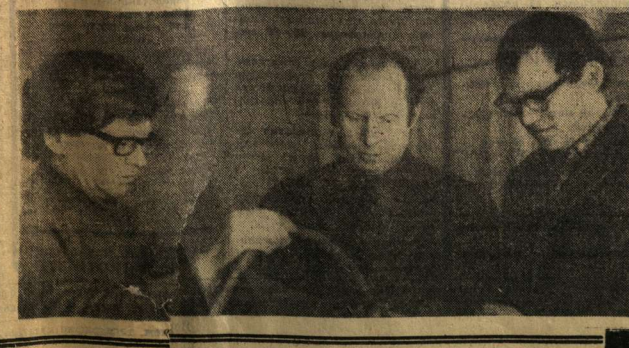
Руководитель службы научно-технической информации металлургического завода Гостандарта СССР.