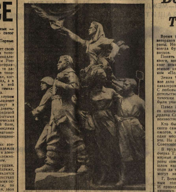
Скульптуры Г. Н. Постникова

Заслуженный художник РСФСР лауреат Государственной премии скульптор Григорий Николаевич Постников один из первых создал произведения, посвященные космонавтам. Композиция «К звездам», «В космос», «Эра космоса» — работы скульптора стали известны во всем мире. Г. Н. Постников издал целую портретную галерею космонавтов, а также портреты многих выдающихся авиачальников. Широко известность получая скульптурные композиции: «Предупреждение», «Вооруженные силы», «Освобожденная Европа». Творения художника экспонируются в разных городах нашей страны, их выставляли на многочисленных всесоюзных, республиканских и зарубежных выставках.