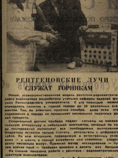
РЕНТГЕНОВСКИЕ ЛУЧИ СЛУЖАТ ГОРНЯКАМ. Новая, усовершенствованная модель рентгено-радиометрического анализатора разработана учеными кафедры ядерной физики Ленинградского университета. С его помощью можно определить наличие в горной породе до 30 различных элементов. Так, он отмечает наличие серы, даже если это содержание в породе не превышает нескольких тысячных долей процента. Специальный датчик прибора подает сигналы на измерительный аппарат и небольшой компьютер, который по ходу исследования выполняет все необходимые вычисления. Оператору остается только считать результаты с цифрового табло. На всю операцию, проводимую в естественных условиях — в шахте, в горной выработке или скважине, уходит всего несколько минут. Прямой метод исследования — путь развития проб — требовал времени в десять раз больше. На снимке показана работа с рентгено-радиометрическим шахтным анализатором.