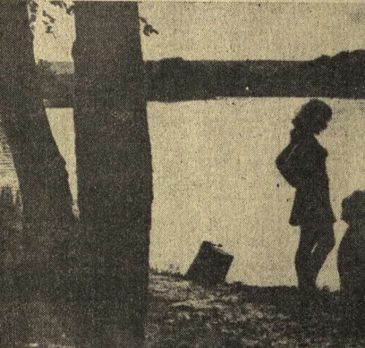
1. Вечерняя мечта. Фото М. Евстратова. 2. Каждому свое. Фото П. Желамского.

забыли, что Венера — это планета, на которой, по мнению К. Перриера, площадь посадочного парашюта спускаемого аппарата станции «Венера-9» (1967 год) составляла 30 квадратных метров. Спуск был с аэрозольного тумана. Температура на поверхности 500 градусов Цельсия и чудовищное давление, примерно в 100 атмосфер. В месте посадки «Венера-9» оказался разный грунт: полностью белый, гравий и кубическом сантиметре. Это то, что известно. Гораздо больше загадок. Одна из них — обитатели планеты.