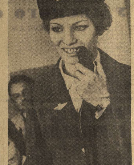
Горькая моя доля...

Стоят два новых дома рядом. Недавно въехали жильцы... Чистота, порядок. Сверкает гладкая паркетная опрятность стек. Ступеньки, точно лаки с маслом. Ну, хоть кафель на них ковер! Он был бы кстати здесь вполне бы... И лифт, как орел небесный ват, в виде, словно на седьмое небо. Достают на любой этаж... Соседний дом, красна, как перерый. Но все же ему не повезло. В парадной двери — Паскельево выбито. Паскельево выбито. Пожаром шредены стекла. В пыли ступеньки. А стены новые погрязли. Картинами омерзели. Рваный, рваный и строгий «Альберт, охотник и стрелок». «Сорей лаво Лоджа». Иль вет: «Ну, Зайцев, погодишь... Сердичка, протренированная нет счета. Владеет окрестки в атолок... Не ходит лифт, поскольку кто-то в стальной двери сломал замок. Чего-то аросит! — Почему же Протренивших не решить проблему? Дома, как бычьи шарниры. С женщинами в носки. Дома с любовью править не буди. Но вот она стена одна! Каким поселился люди. Таковыми стали и дома! Н. СЕРГИЕНКО.