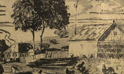
Рис. художника Г. Гончарова.

Ю. ДМИТРИЕВ, профессор, доктор искусствоведческих наук.