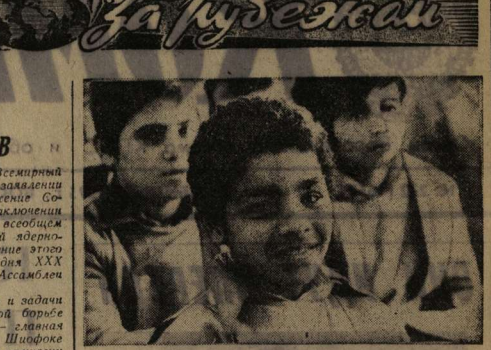
Заботой и вниманием окружены в Сирийской Арабской Республике дети, родители которых погибли в результате агрессивных действий Израэля. В Дамаске для них построены социальные школы-интернаты.