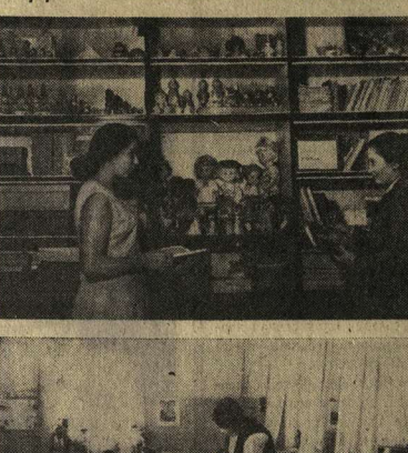
Менья всегда танет в родное село, на родную улицу...