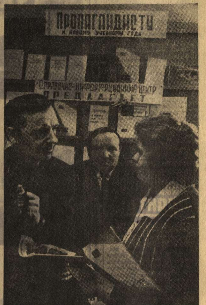
Новгородская область. При партийной организации колхоза «Урожай» создан справочно-информационный центр...