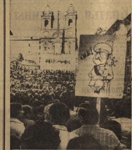
РИМ. Гнев и возмущение вызвало в Италии известие о приезде в столицу советских привороженных пяти испанских антифашистов. В Риме, Милане, Болонье, Генуе, Турине и других городах страны состоялись массовые митинги и демонстрации протеста против нового акта кровавого террора, развязанного франкистским режимом. НА СНИМКЕ: демонстранты на улицах Рима.

ТИМА. Немедленного освобождения Луиса Корвалана и других патриотов потребовали Перуанская коммунистическая партия, Всеобщая конфедерация трудящихся Перу, Конфедерация трудящихся Перу, многие общественные организации страны в опубликованном здесь совместном заявлении. (ТАСС).