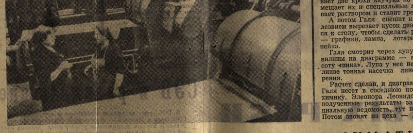
В честь XXV съезда КПСС коллектив принял повышенные социалистические обязательства, направленные на увеличение выпуска продукции, улучшение ее качества и повышение эффективности производства.